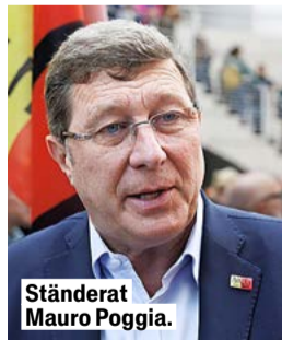
Ständerat Mauro Poggia.

«Die Meinungsfreiheit erlaubt es, auch unangenehme Dinge zu sagen, und das muss man akzeptieren. Aber es darf nicht als Vorwand dienen, um alles durchgehen zu lassen», sagt Poggia gegenüber «Le Temps».