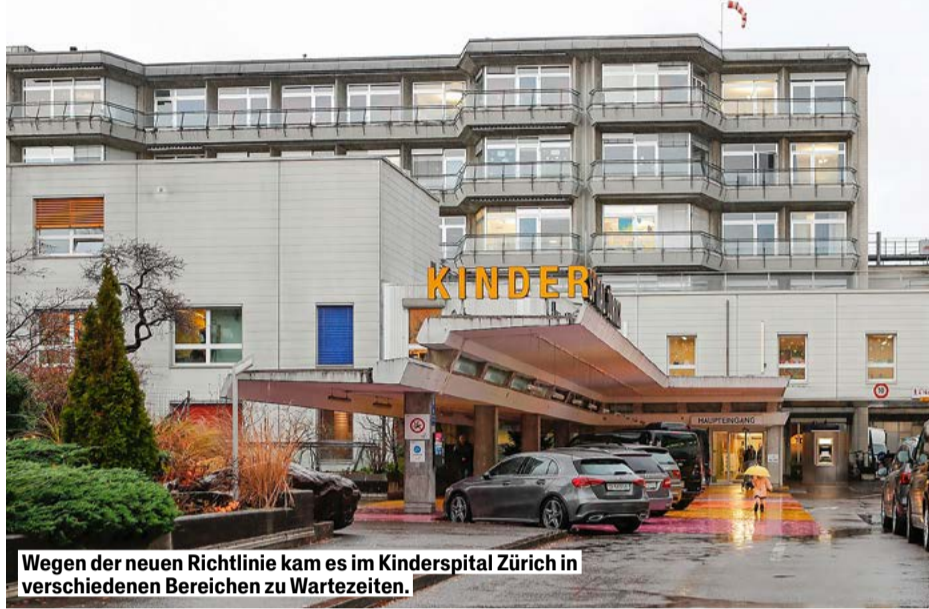
Wegen der neuen Richtlinie kam es im Kinderspital Zürich in verschiedenen Bereichen zu Wartezeiten.