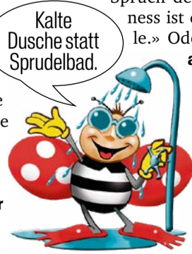
Kalte Dusche statt Sprudelbad.