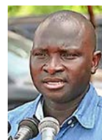
Ex-Minister Ousman Sonko.

Die Bundesanwaltschaft wirft Sonko vor, vorwiegend in Mithäterschaft mit anderen gambischen Führungsmitgliedern von 2000 bis 2016 zahlreiche Verbrechen begangen zu haben.