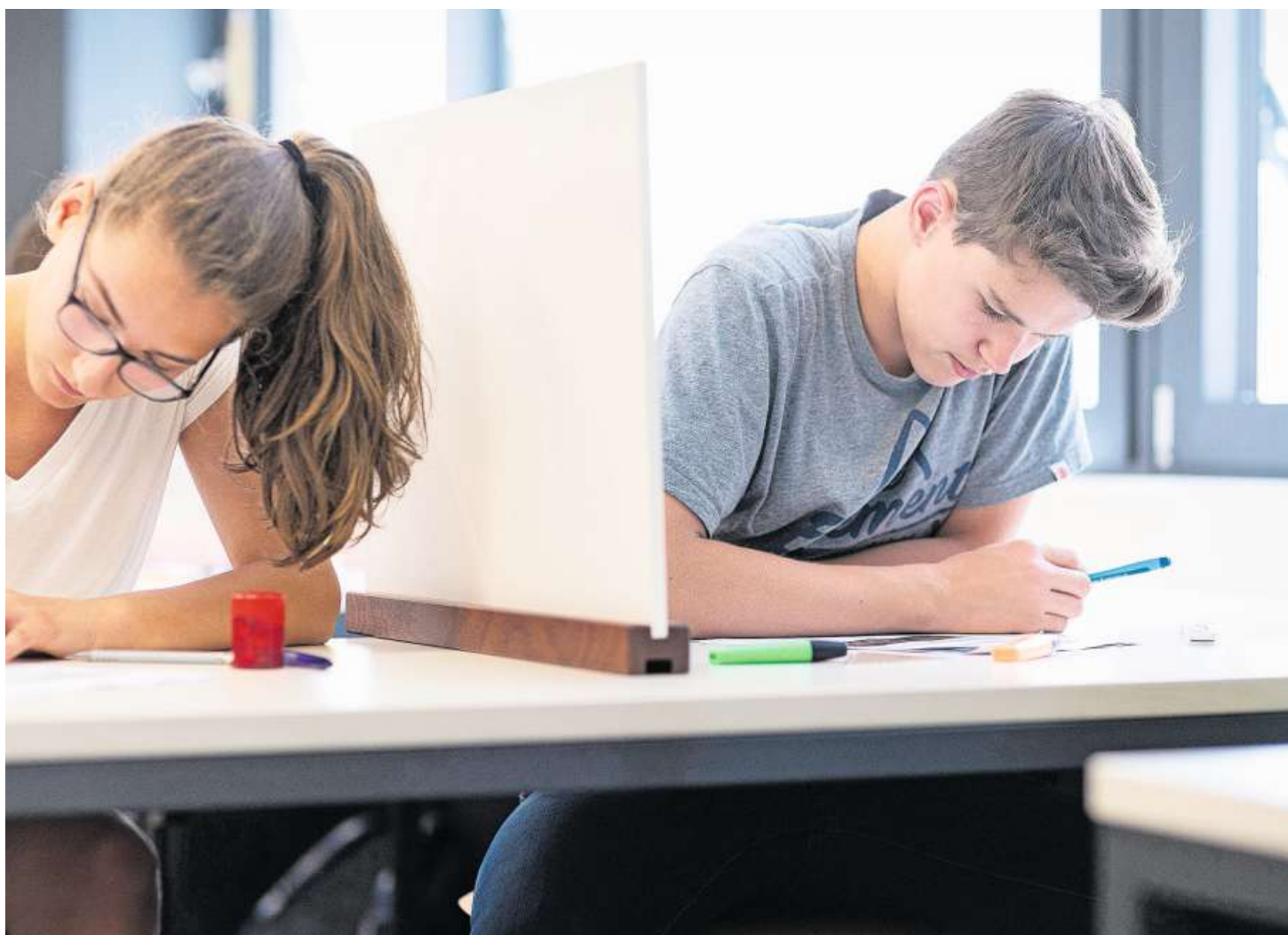
Matura mit oder ohne Prüfungen? Diesen Entscheid fällen die Bildungsdirektoren bis Anfang Mai.